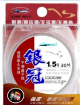
银冠：高强、特别耐磨耐久、绝不拉长、延展、变形

主线子线通用的高档高强度手竿线。具有最大的直线强度、最大的耐磨性和最好的抗卷曲效果。略显硬的线质，非常利于速钓时作子线，也非常适合作主线使用。