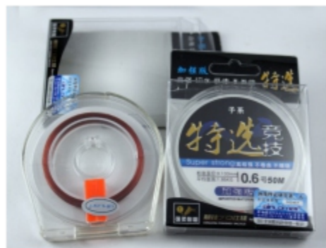
久战、竞技线性能图示

这是一款高档的加强手竿线。强度特别大，但线仍然比较柔软。主线切水好而且延展极小，子线卷曲很少，结强非常高而稳定，耐久性好，不会发生意外断线的情况。